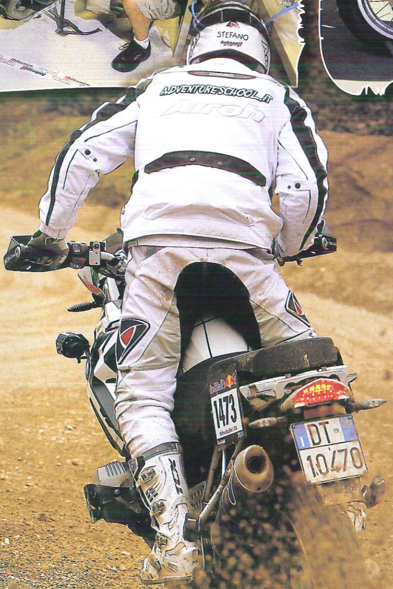
Sopra, da sinistra, al lavoro con i tecnici di Andreani nella sede di Cattolica, il momento della partenza con la BMW assettata da viaggio e poi in gara a sparare ghiaia...

> Ho percorso i primi 400 metri tra gli applausi e i suoni di trombe, sempre una bella sensazione. Prima curva, prime buche e gli Ohlins hanno avuto subito vita dura. Tenere fermi 245 kg nelle buche prima delle curve è impossibile e i fondocorsa sono stati infiniti, nonostante un'idraulica più chiusa e una molla più dura. Però se si registrava una sospensione ancora più dura, sarebbe poi stato impossibile percorrere le curve a bassa velocità sui sassi viscidati, ero davvero al limite. Ho dovuto guardare molto lontano ed evitare le buche, anche finendo fuori dalla traiettoria ideale, segnata dai precedenti concorrenti. Con la GS è impossibile buttarsi nei canali e uscire di potenza e anche sui sassi bagnati dalla pioggia, le gomme Continental sono progettate per garantire un maggior grip su terreni compatti, ma allo stesso tempo offrire un buon chilometraggio su asfalto. Insomma gomme studiate per i raid nei deserti. Una gomma da Enduro con mousse ha un grip nettamente differente da una gomma On/off gonfia a 1.7 bar, e scendere sotto con la GS si ri-