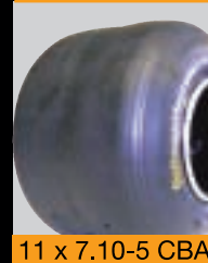
11 x 7.10-5 CBA