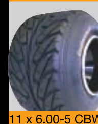
11 x 6.00-5 CBW