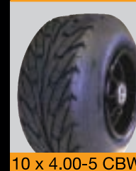
10 x 4.00-5 CBW