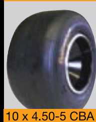
10 x 4.50-5 CBA